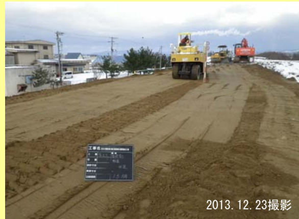
ローラーで土を締め固め