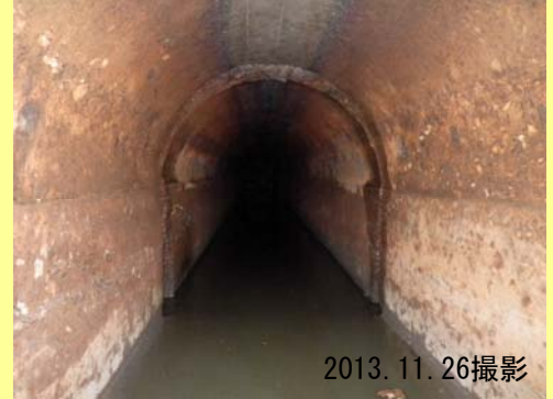
▼取り壊し前の樋管の中の様子