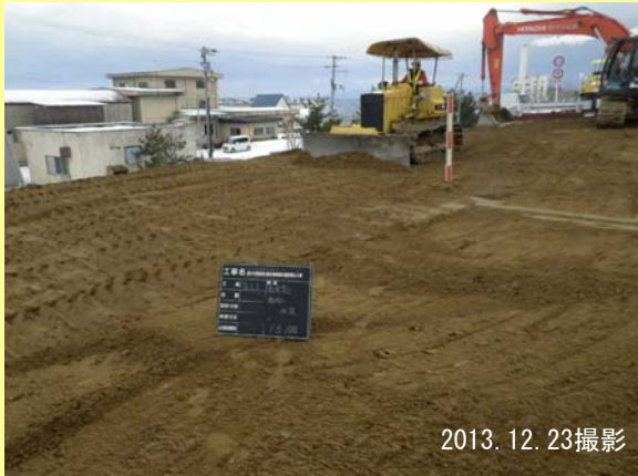
バックホーやブルドーザで土を敷き均し