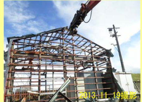
▼建屋 取り壊しの様子