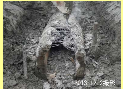
▼樋管 取り壊しの様子