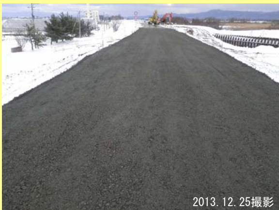
締め固め路盤完成！